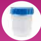
BOTE ESTÉRIL DE PLÁSTICO 4 UNIDADES