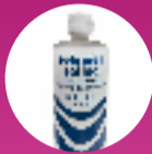
SOLUCIÓN SALINA O SUERO FISIOLÓGICO 1 LITRO