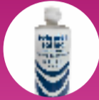
SOLUTION SALINE OU SÉRUM PHYSIOLOGIQUE 1 LITRE

On peut les acheter en pharmacie et dans les magasins de bricolage