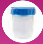
BOÎTES STÉRILES EN PLASTIQUE 4 UNITÉS